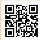
Carte des Vins

Les informations sur les allergènes présents dans les plats sont à votre disposition au niveau de la caisse. Information on the allergens present in the dishes is available at the checkout.